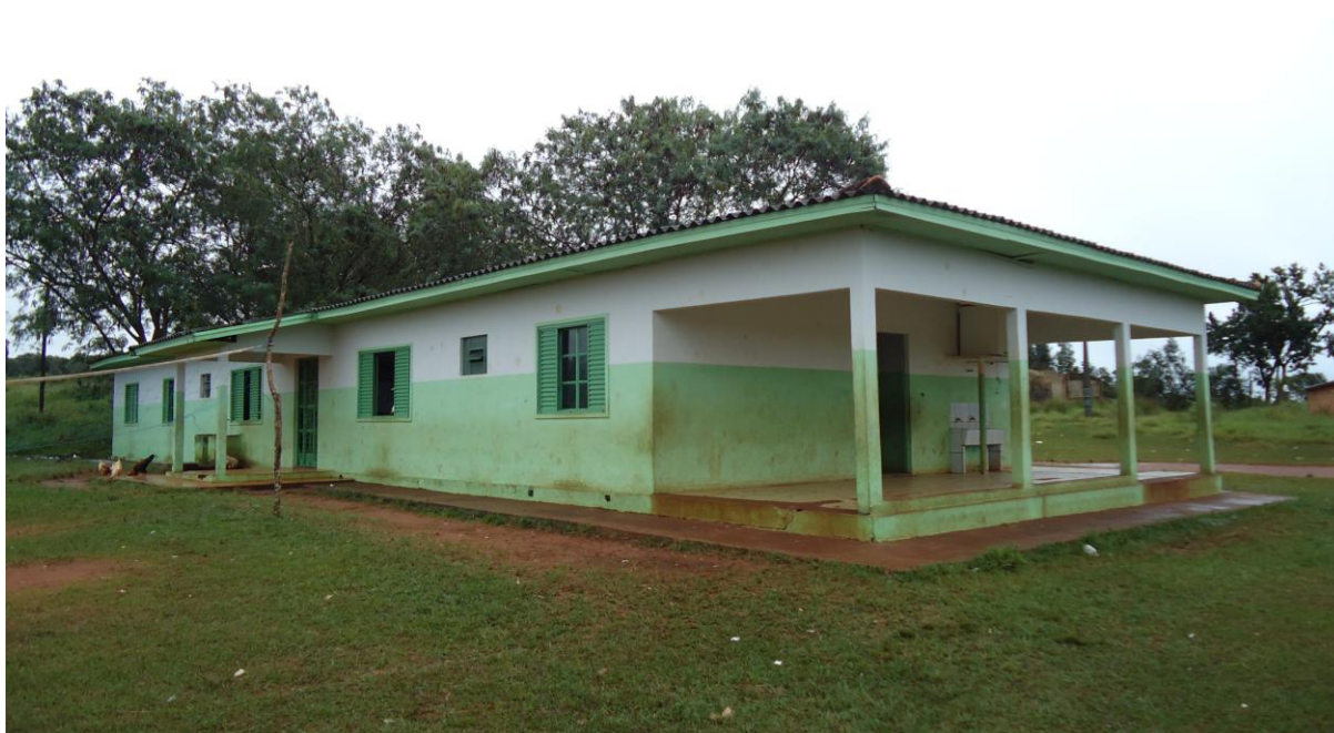
Fotografia 1 - Fachada Escola Municipal Indígena Mbo'ero Tava Okara Rendy