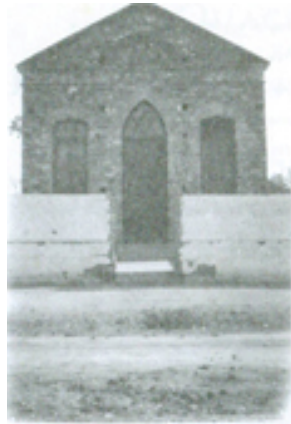
Foto número 19-B Templo PIB em Corumbá