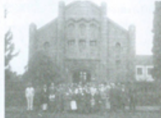
Foto número 30 Grupo de membros da PIB em Campo Grande em frente ao Templo antigo