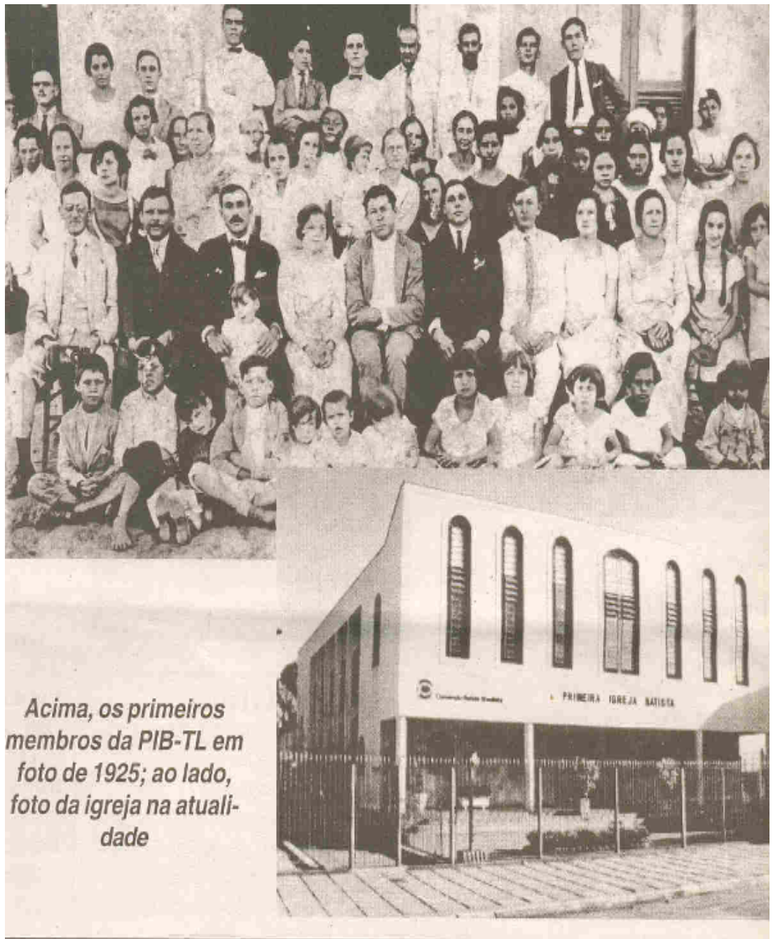
Acima, os primeiros membros da PIB-TL em foto de 1925; ao lado, foto da igreja na atualidade

Templo atual da Igreja Batista de Três Lagoas construído em 1991 (fonte: PIB é a pioneira em Três Lagoas. Boas Novas. 1ª Quinzena de março de 2002, ano II, n 19, p. 3).