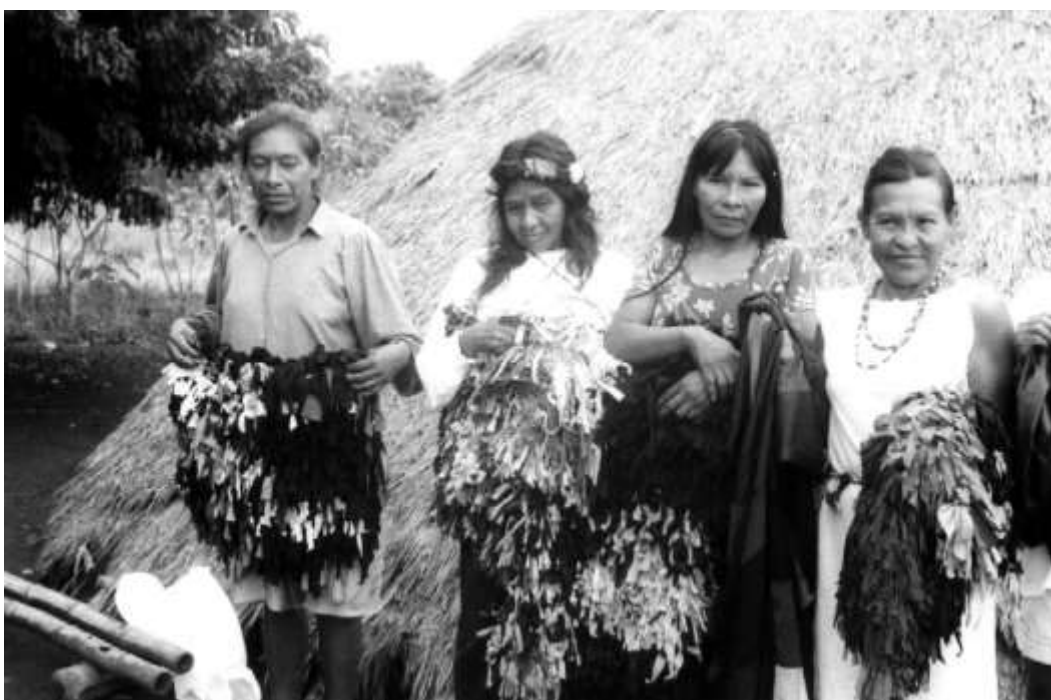
Figura 4. Trabalho de subsistência indígena. Índias Bororos.

Nesta pastoral, encontram-se os povos indígenas. Após vários encontros entre missionários e índios, nasceu a proposta de uma coordenação nacional da atividade missionária indigenista, sob a forma de um Conselho, cujo nascimento deu-se em 1972, com o nome de Conselho Indigenista Missionário – CIMI, ligado oficialmente à CNBB.