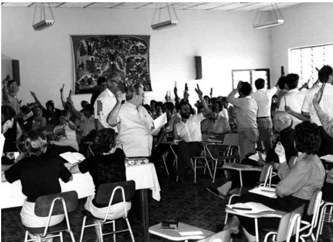
Figura 8. Votação das propostas do Sínodo.

Durante os quase três anos de discussões do Sínodo, ocorreram quatro etapas específicas de trabalho, sendo que a Comissão Pastoral da Terra e o Conselho Indigenista Missionário foram discutidos e delimitados a partir da discussão do papel do leigo na Igreja. Assim, analisaremos cada uma das quatro etapas, observando a temática e as propostas de trabalho enquanto diretrizes a serem postas em prática na Diocese.