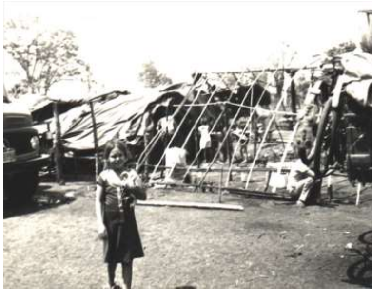
Figura 7. Assentamento temporário na Vila São Pedro.