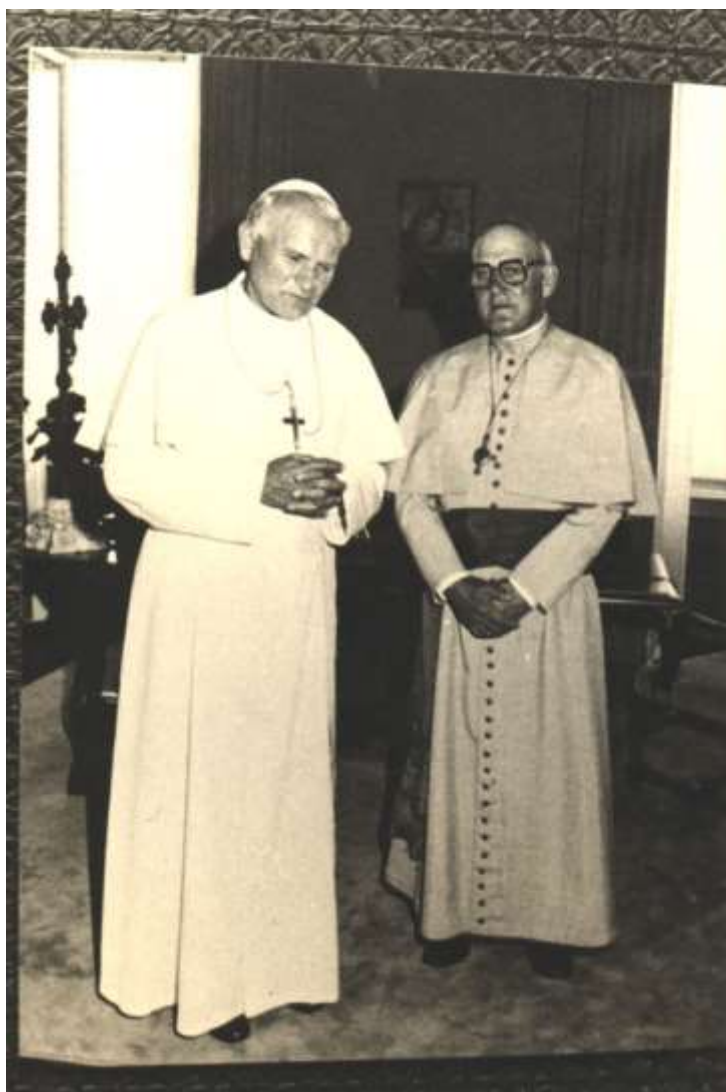
Figura 2. D. Teodardo com João Paulo II. Visita à Santa Sé