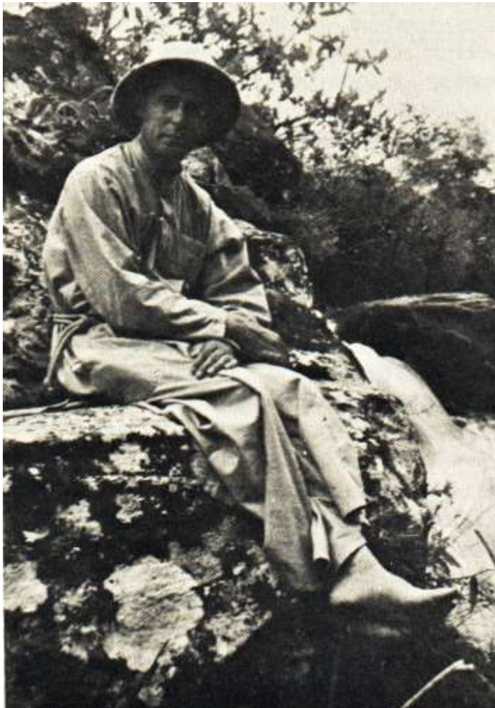
Reprodução de A Missão Franciscana do Mato Grosso , p. 114.

Pela distância e pela falta de clérigos, a desobriga acontecia uma vez por ano, sempre com datas previamente marcadas. Esta realidade aos poucos começou a mudar,