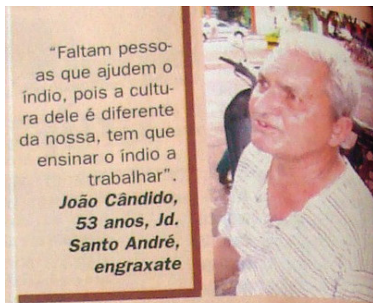
Figura 6 - Detalhe da enquete O Povo Fala de 22 de fevereiro de 2005.

Esses conceitos são importantes para esse trabalho porque, em geral, a imprensa representa a imagem do índio como preguiçoso, selvagem, que vive na floresta, de maneira rudimentar, ou seja, que não utiliza ferramentas e nem tecnologias (OLIVEIRA, 1999). Essa representação é projetada para os indígenas atuais em momentos críticos, como no caso da desnutrição indígena, no início de 2005. Assim, a imprensa desconsidera todos esses fatos mencionados em detrimento de uma visão parcial e com forte carga de preconceito. Por mais que tenhamos comunidades indígenas próximas às cidades, com forte contato entre os representantes desses dois locais, o que predomina é a idéia de indígena conforme citado acima, como se verifica na declaração do engraxate ouvido pelo jornal O Progresso , em uma enquete denominada O Povo Fala , no dia 22 de fevereiro de 2005, em que a pergunta era: Qual a sua opinião sobre a mortalidade infantil por desnutrição nas aldeias de Dourados? :