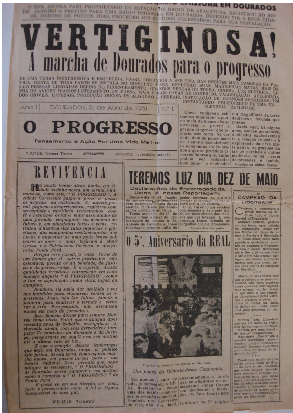
Figura 4 – Capa do Jornal O Progresso de 1951 destaca o grande fluxo populacional que se instalava na região

Nessa corrida pelas áreas fronteiriças, a especulação de terras é mais um agravante para as comunidades indígenas que viviam na região. Na capa do jornal, não há menção à presença indígena na região, o que justifica os atuais conflitos fundiários. Apenas o aspecto desenvolvimentista é destacado. A manchete se resume