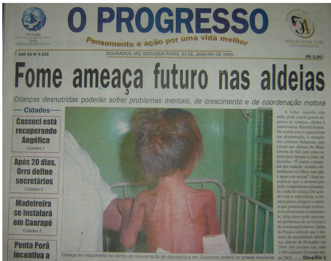
Figura 9 – Primeira explicação para casos de desnutrição apontavam a cultura como causa

A capa acima (O PROGRESSO, 24 jan. 2005) possui um forte apelo visual para sensibilizar as pessoas. A foto traz a imagem de uma criança em estado de desnutrição e isso desperta a piedade na maioria das pessoas, principalmente por ser uma criança, indivíduo que normalmente remete ao sentimento de proteção dos adultos. O título reforça essa idéia ao associar a fome ao futuro das aldeias. É importante frisar que o leitor não lê a imagem de forma global, mas antes vai fixando seu foco nos aspectos da imagem mais dotados de informação e que mais lhe despertam o interesse, processo denominado por Aumont (1993, p.60) como busca visual ou exploração ocular.