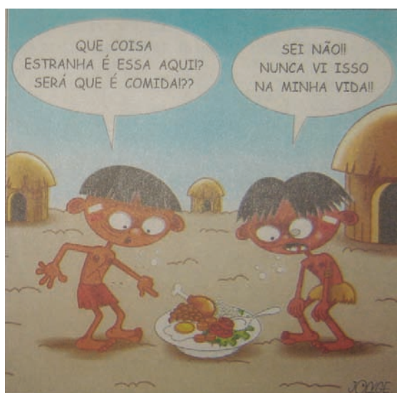
Figura 10 – Charge publicada na capa do jornal, após quatro dias das primeiras manchetes sobre a desnutrição

Os textos dos jornais produziram sentidos que permaneceram ao longo do tempo e se tornaram de difícil desmontagem, o que Orlandi (1990, p. 15) chama de “efeitos de sentido”, expressão que diz respeito às conseqüências sociais das práticas discursivas, no caso em questão a prática jornalística.