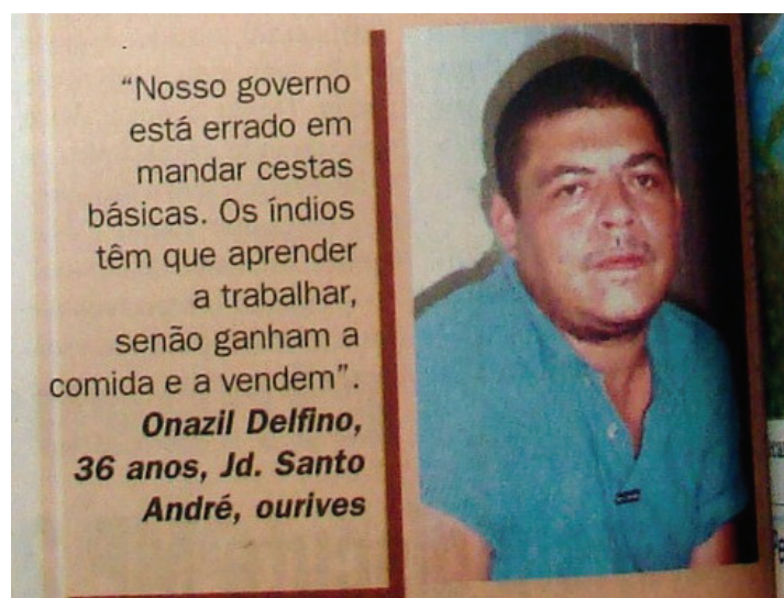
Figura 7 – Enquete O Povo Fala, em que o depoimento de uma pessoa pode ser entendido como reflexo da noção de inferioridade dos indígenas

Na enquete já citada, que fora publicada no dia 22 de fevereiro de 2005, tem-se na declaração do ourives que critica a distribuição, a demonstração da perspectiva do indígena como indolente: