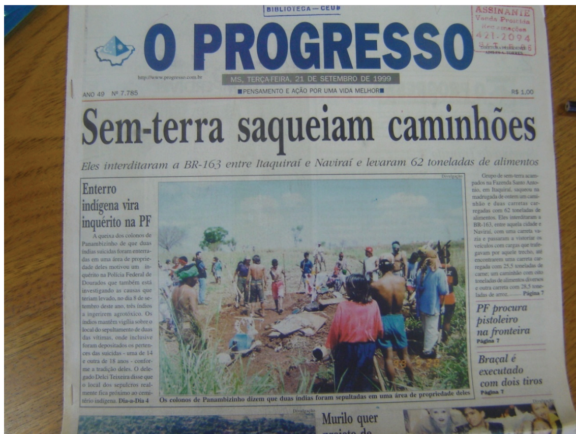
Figura 1 – A questão indígena é e as ações do MST dividem a capa do jornal

A capa do jornal acima (O Progresso 21 set, 1999) pode ser considerada um exemplo de que as questões indígenas dividem o espaço nos jornais com notícias sobre outros movimentos sociais, como o MST – Movimento Sem-Terra. A foto sobre a reivindicação dos indígenas está logo abaixo da manchete sobre o MST. Nas duas, predomina o tom sensacionalista, pois os movimentos são relacionados a atos criminosos: o saque realizado pelo MST e a abertura de inquérito policial para apurar a solicitação dos indígenas para sepultar uma indígena no local de sua morte, conforme a tradição guarani 2 . O impasse ocorre porque as mortes ocorreram nos limites de uma fazenda de propriedade privada.