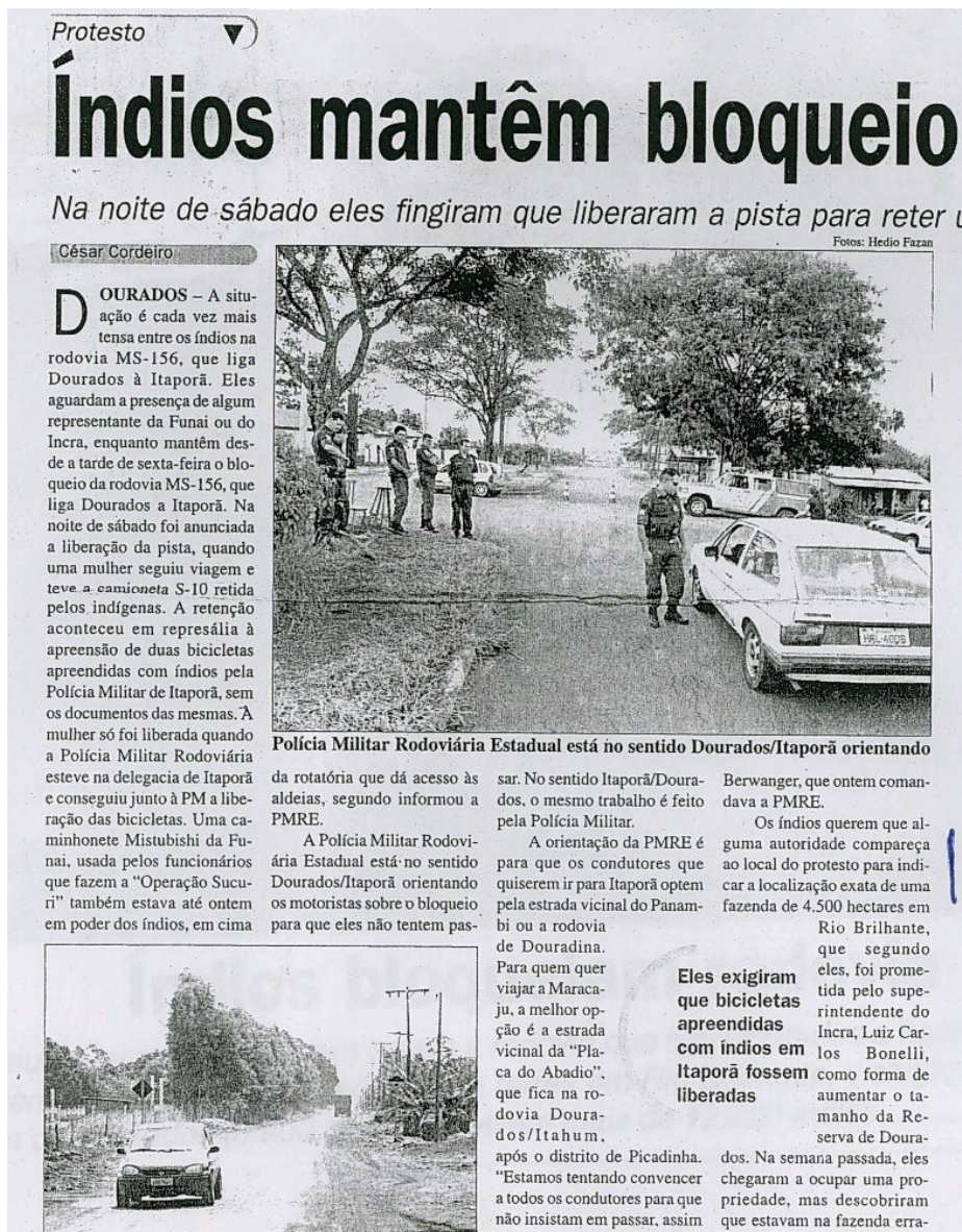
Figura 11 – Motivo para bloqueio é apresentado apenas no último parágrafo

Esta reportagem ocupa metade da página três do caderno Dia-a-dia, em página colorida (apenas a reprodução é preta e branca), local de grande visibilidade: a página da matéria é ímpar, local valorizado por que, em geral, o leitor percorre o olhar da direita para a esquerda e sua atenção tem mais chance de se deter nos elementos que estão à direita.