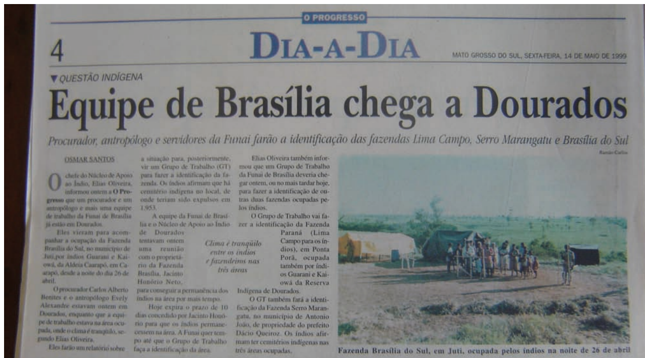
Figura 2 – Notícia sobre a chegada da equipe da Funai que seria responsável pela identificação de três áreas em litígio na região de Dourados

Essa notícia (O PROGRESSO, 14 Maio 1999) ilustra bem a quantidade de reivindicações das comunidades indígenas, pois relata a chegada da equipe da Funai para realizar o levantamento de três áreas. Difere-se das demais matérias sobre as reivindicações indígenas por enfatizar na janela, elemento gráfico utilizado para orientar a leitura, o clima tranquilo nas três áreas. A foto também reforça essa mensagem, retrata o acampamento e um elemento religioso dos kaiowá: o mba'e marangatu , produzido com taquara e que tem a finalidade de proteger as portas de entradas das moradias desse grupo étnico.