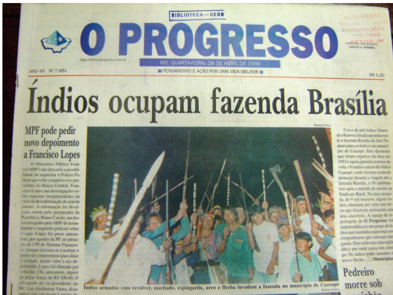
Figura 4 – Foto destaca armas, a reivindicação tem caráter secundário

Uma análise mais detalhada demonstra que a cena foi cuidadosamente estruturada: os indígenas com arco e flecha, que seriam as armas tradicionais indígenas, ficaram ao fundo, na frente estão os que seguram as espingardas e machados. A maioria dos indígenas empunhava o yvyrá pará , bastão decorado que serve para as fainas domésticas, divertimentos comunitários e incursões na mata. A expressão das crianças, no canto esquerdo da fotografia, aponta que não era um momento tenso, uma delas está sorrindo.