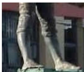
Imagem 4 (recortada a partir da imagem 2).

As mangas da camisa e calça estão dobradas num sentido de atividade, esse homem trabalha e seu lugar é o garimpo.