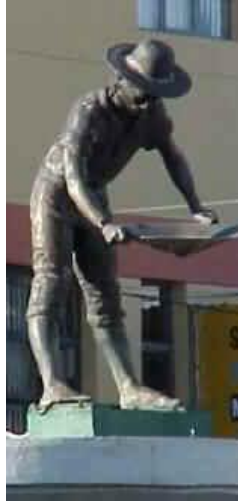
Imagem2 (recortada a partir da imagem 1)

A figura, ou melhor, o monumento-documento-monumento torna-se uma produção de dupla imaginação: a primeira relaciona-se ao projeto de criação do monumento como forma de comemoração, e a segunda, está ligada a uma condição de esforço mental daquele que busca interpretar ou de tornar o monumento como documento (no ato da narrativa a interpretação legitima o monumento como documento-monumento). Por meio dessa seqüência de proposições, a segunda imagem, representa um foco especialmente destinado ao garimpeiro. Uma figura notável.