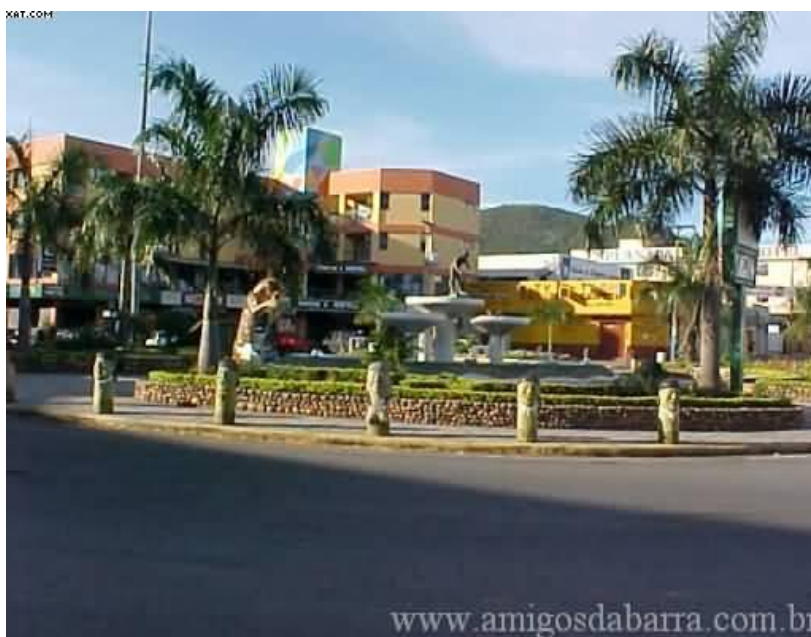
Imagem 1 (extraída dia 16.06.07)

Algumas proposições são encontradas para leitura imagética nesta fonte (partindo de uma descrição da mesma). Essa é uma das últimas formas apresentada até o